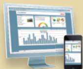
StecaGrid Portal Web-Portal