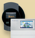
Solar-Log™ und Meteocontrol WEB'log Zubehör